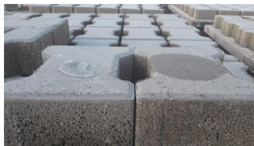
Бетонски елемент третиран со Фасил В